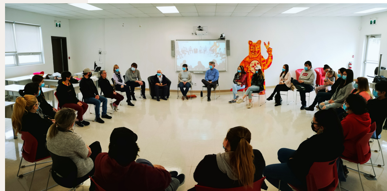
Cercle de parole sur le thème de la colonisation et de ses impacts

Ouvert également au grand public, cet événement annuel t'offre la possibilité de bonifier tes connaissances sur divers sujets d'actualité. De plus, des activités culturelles sont organisées tout au long de la semaine, te permettant d'ancrer tes apprentissages dans des expériences concrètes.