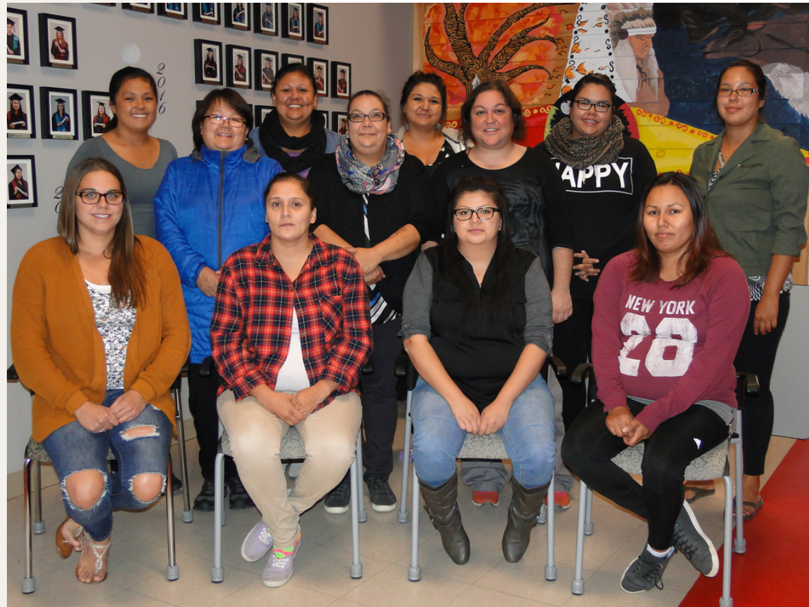
Étudiantes en Éducation spécialisée

Avoir terminé au moins une année d'études postsecondaires échelonnée sur une période d'un an ou plus.